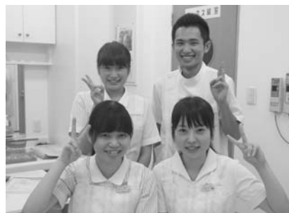
明るい笑顔のスタッフ