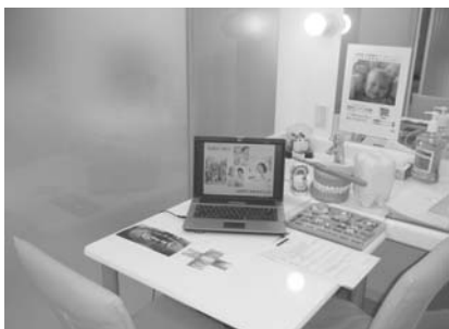
患者さんの納得がいくまで話し合う カウンセリングルーム